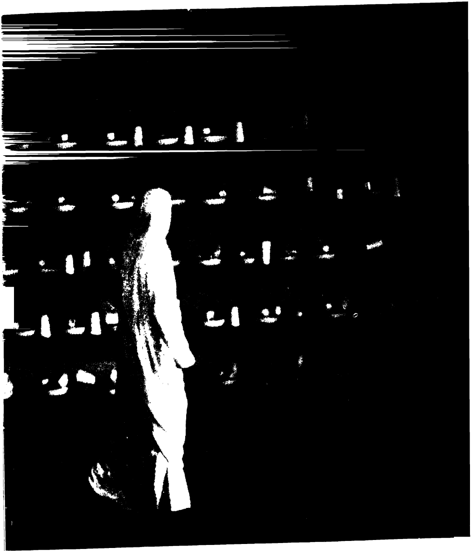
भिक्षुणीहरूको खाना बनाउने भाँडौँवर्तन